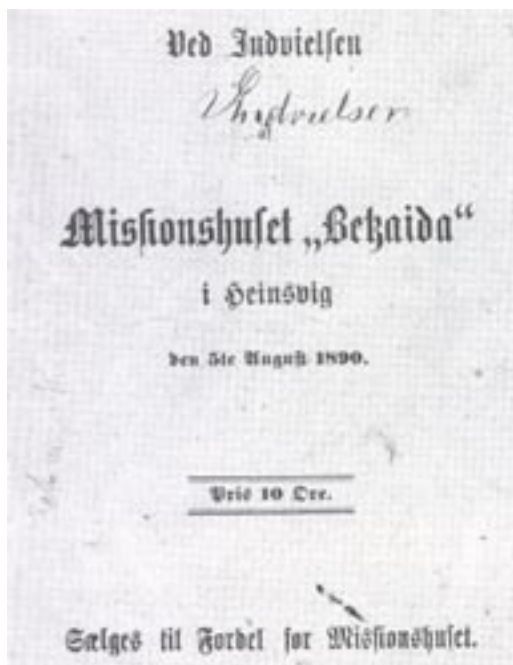
Sangblad fra indvielsen af Missionshuset Betsaida i Klink i 1890.