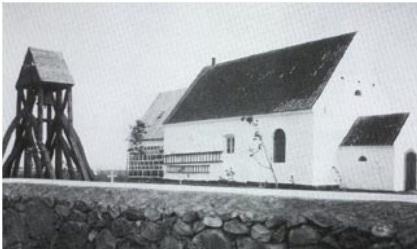
Foto af Hejnsvig Kirke set fra nord-vest hen over nordre kirkegårdsdige. Til venstre ses klokkestablen, som blev nedtaget i forbindelse med kirkens udvidelse i 1918 - 19.