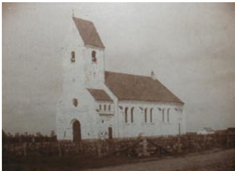
En nyopført Vesterhede Kirke set fra sydvest. En indgangsdør på sydsiden af tårnet er siden blevet lukket af. Den nyanlagte kirkegård ser meget anderledes ud end i dag.

Der blev afholdt offentlig licitation den 6. juli 1909. Byggeriet blev overdraget til muremester Carl Petersen, Vorbasse, som skulle have alt arbejdet med undtagelse af inventaret ved alter og døbefont. Carl