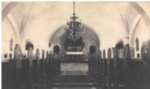
Hejnsvig Kirke efter ombygningen i 1918, men før 1924!

"Der var samlet ca. 200 mænd og kvinder, et vidnesbyrd om, at præstefolkene havde i de omtrent fire år, de havde været i Hejnsvig, vundet en stor plads i menighedens hjerter. Det var en venneskare, der for sidste gang vilde samles med deres kære præstefolk. Mange tidligere konfirmander var komne til stede. Som et synligt bevis på venskabsforholdet