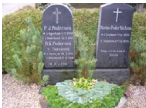
Den ældste gravsten på Vesterhede Kirkegård